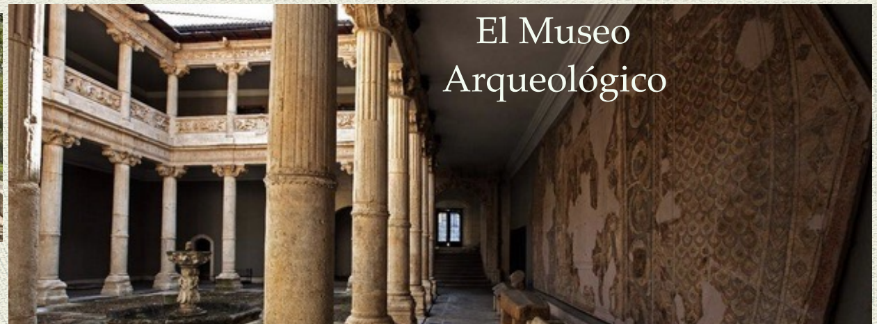
El Museo Arqueológico