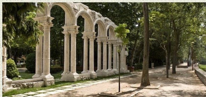
El parque de la Isla