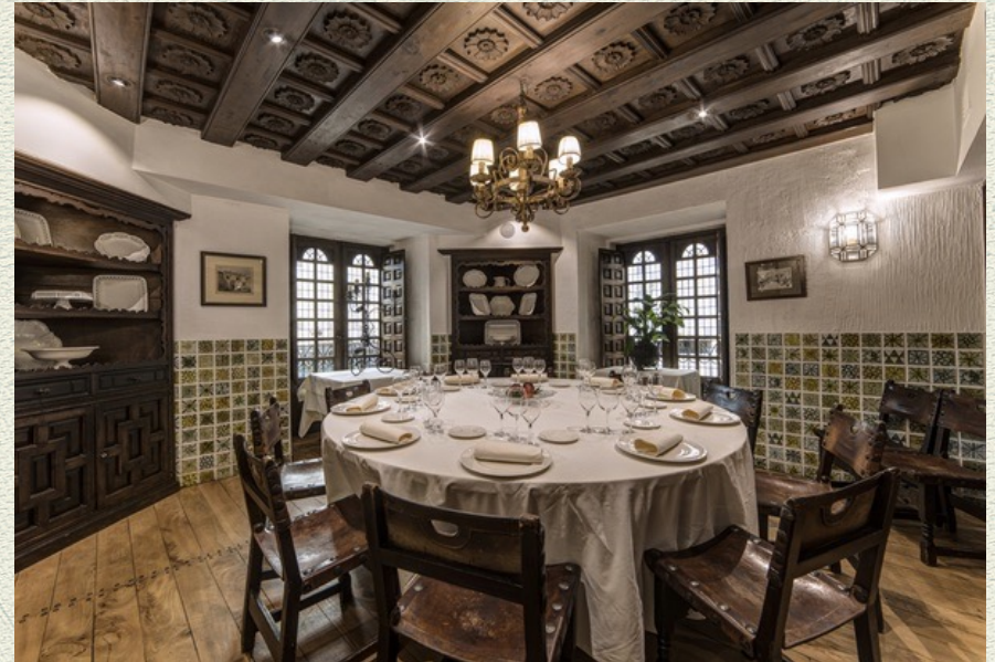
El restaurante Ojeda