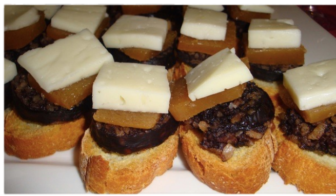
Morcilla de Burgos con queso, membrillo y pan