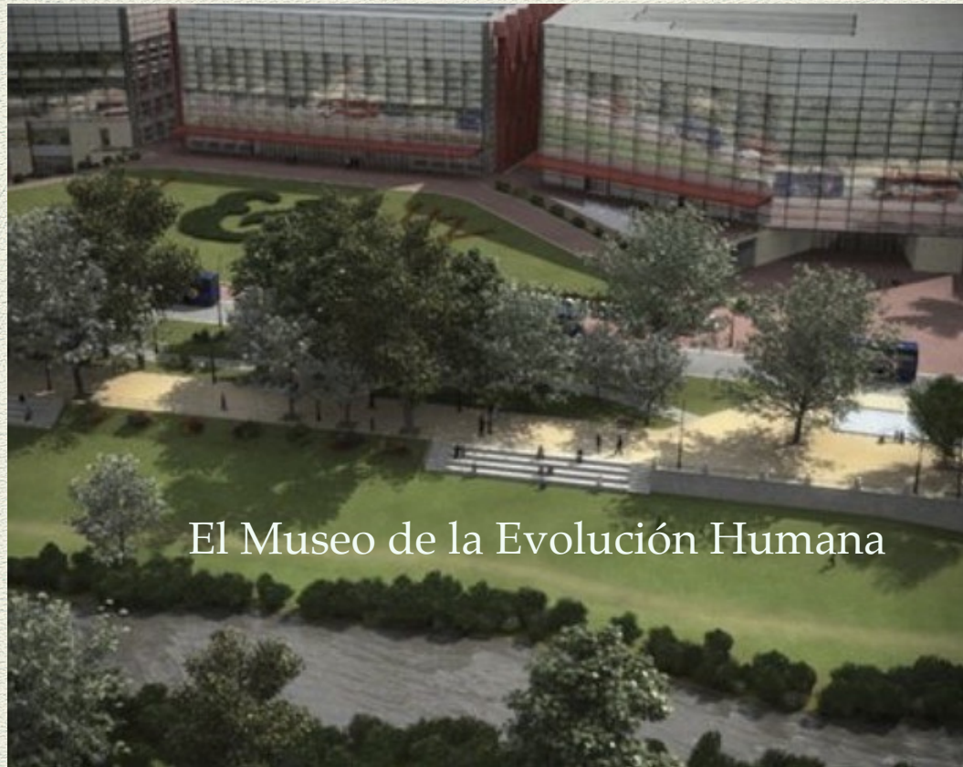
El Museo de la Evolución Humana

En Burgos también hay muchos parques y tiendas, museos interesantes y restaurantes tradicionales.