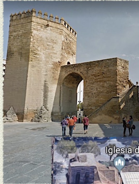
Iglesia de San Hipólito