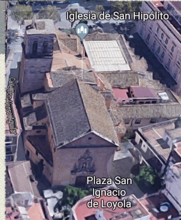
Plaza San Ignacio de Loyola